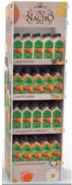
Tío Nacho "end-caps", ejemplo de estrategias de visibilidad en el punto de venta

invernal, de donde no se reflejó ningún impacto positivo en ventas. Adicionalmente, los gastos de logística incrementaron substancialmente durante el trimestre, debido a mayores costos de flete, en línea con la escasez de choferes en la industria. En menor medida, durante el trimestre, algunos gastos corporativos fueron reconocidos en las diferentes regiones donde opera Genomma, impactando parcialmente los márgenes.