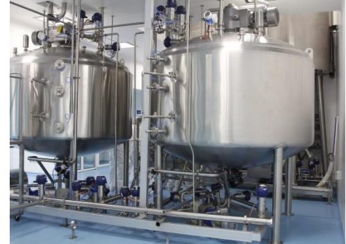
Equipo de producción para planta OTC